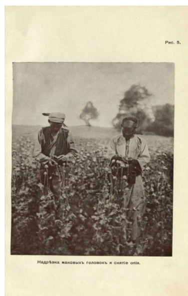
Рис. 5. Надъёна мановыкъ головокъ и снятё опя. Сурет 3 - Көкнар жинау [Figure 3 – Poppy harvesting]

Олар жеңілдетілген шарттармен ұзақ мерзімге жалға берілуі керек те жал ақысын төлеу апиынның базарға жеткізіліміне тікелей тәуелді болуы керек.