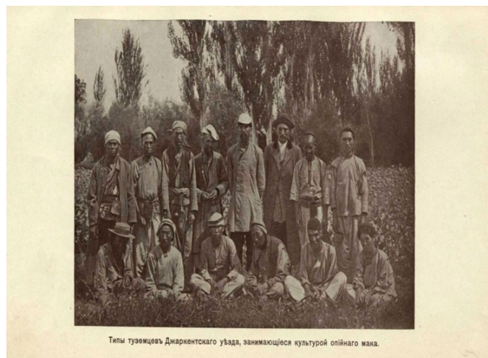
Тилы туземцев Джаркентского уезда, занимающихся культурой опийного мака. Сурет 2 – Бір топ көкнар егушілер [Figure 2 – A group of poppy cultivators]

Апиынның нарықтық бағасы қаңтарда 300 миллион рубльге (1921 жылғы есеп бойынша), немесе, бір гинге (жин = 1,5 фунт) жетті. Бұл бағалар алыпсатарлық, бірақ қалыпты коммерциялық бағалар егіншілердің еңбегін еселеп төлейді.